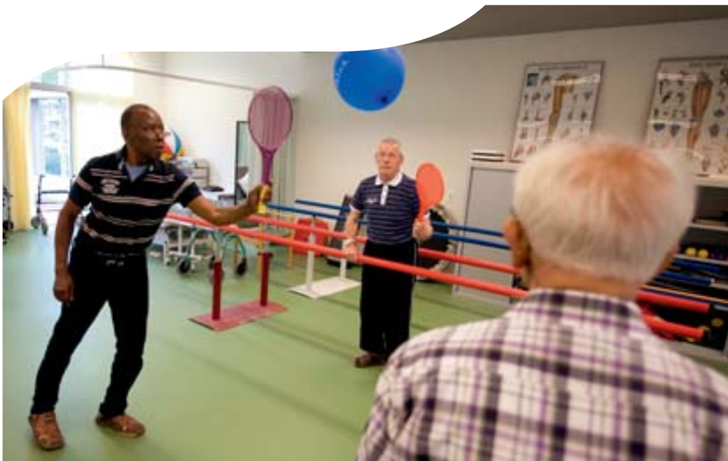
Gezond bewegen met een fysiotherapeut

Mensen met dementie zijn meestal gebaat bij een rustige, vertrouwde omgeving waarin huiselijke en herkenbare activiteiten plaatsvinden. Het zelf kunnen uitvoeren van handelingen, hoe klein ook, is belangrijk voor de eigenwaarde. Vandaar dat cliënten worden betrokken bij de huishouding en bij gezamenlijke activiteiten. De cliënt kan helpen bij het bereiden van het eten, het dekken van de tafel, het inschenken van koffie, het doen van de afwas, de was opvouwen, strijken en eenvoudige schoonmaakklusjes. De begeleiding ervan door onze medewerkers geschiedt met inlevingsvermogen, takt en geduld.